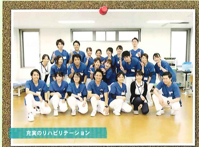
充実のリハビリテーション